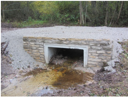
Passage du Preslong

Il y a un an, le pont en bois du ruisseau du Preslong, à Champeau-en-Morvan, s'est effondré, empêchant de ce fait la circulation des usagers sur le chemin communal et des espèces dans le ruisseau. Afin de rétablir les deux passages, le Parc du Morvan a entamé, cet automne, des travaux de remplacement du pont défectueux.