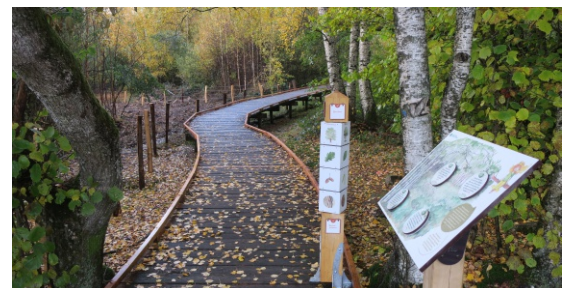
Aménagements pédagogiques et clôtures au Domaine des Grands Prés

Nous espérons y retrouver les espèces typiques des prairies humides dans les prochaines années.