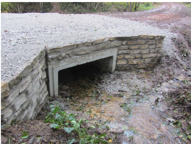
Installation d'un dalot au-dessus du ruisseau pour permettre son franchissement et restaurer la continuité écologique

A Champeau-en-Morvan, dans la vallée du Cousin, l'objectif du contrat était de restaurer la continuité écologique en installant un franchissement permanent sur le Preslong. Le contrat s'inscrivait dans la continuité des deux programmes européens LIFE, consacrés aux cours d'eau de tête de bassins versants.