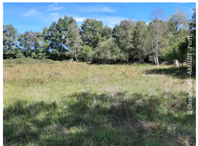
Prairie paratourbeuse restaurée au Domaine des Grands Prés, à Saint-Agnan

L'objectif du projet était de rouvrir 3ha du Domaine des Grands Prés, afin de restaurer la prairie humide paratourbeuse . Pour cela, le contrat a consisté en la pose clôture, du débroussaillage d'une partie de la prairie et de la mise en pâturage.