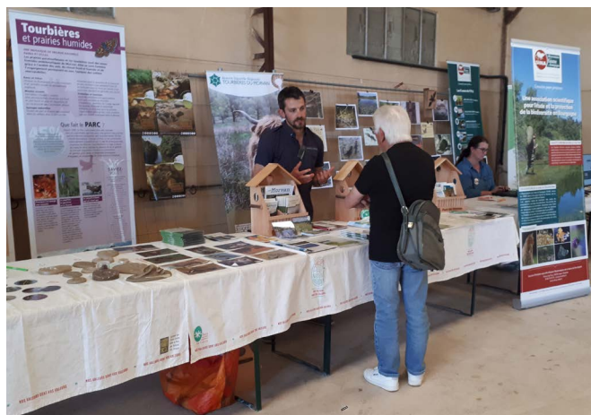
La tenue de stand permet de rencontrer les visiteurs et mieux parler des actions du Parc

C'était également l'occasion de (re)découvrir l'exposition « Morvan, terre de nature », qui présente les grands types de milieux naturels présents dans le Morvan, leurs spécificités, la biodiversité qu'ils hébergent et comment l'intégrer dans son quotidien. Plus de 650 personnes dont 150 scolaires étaient au rendez-vous.