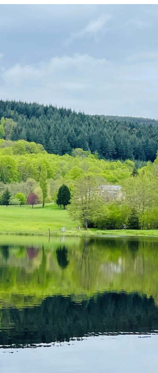
ne DESMARQUET - Vert