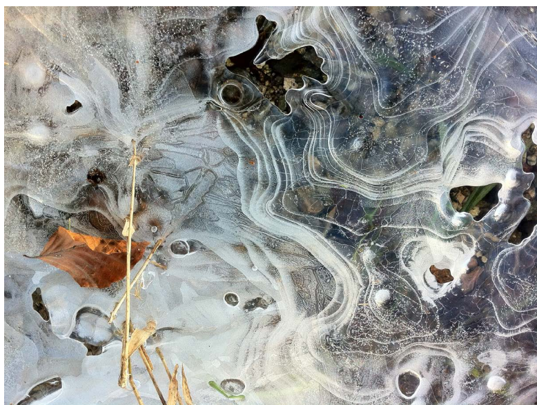
2 e prix du jury

Elles y resteront exposées jusqu'à la fin de la saison touristique, fin novembre 2022.