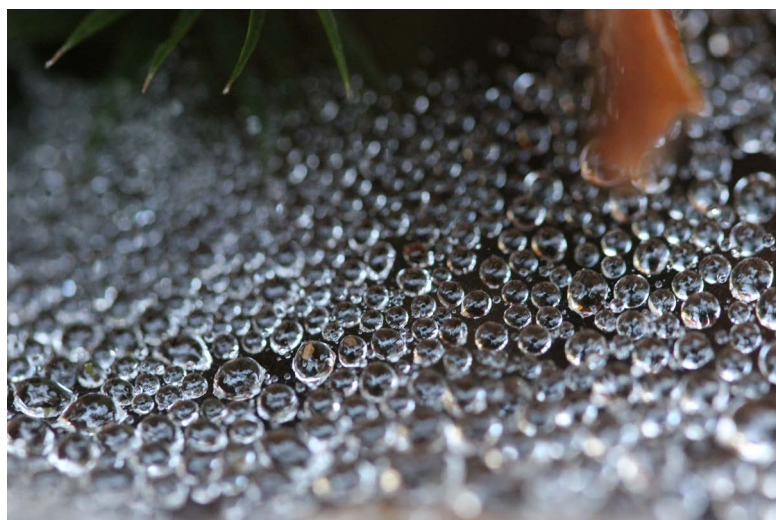
Prix spécial du jury