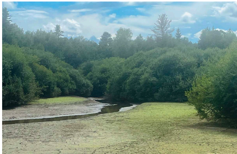
2 e prix jeune