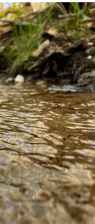
oujours à la rivière