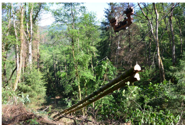
Débardage à cheval dans la vallée de la Canche (en haut) et par câble sur le Mont Beuvray (en bas)